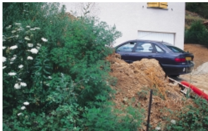
Dans les zones pavillonnaires, il faut encourager un aménagement rapide des jardins pour éviter le développement de l'ambroisie sur les terres rapportées ou remuées par le chantier de construction.