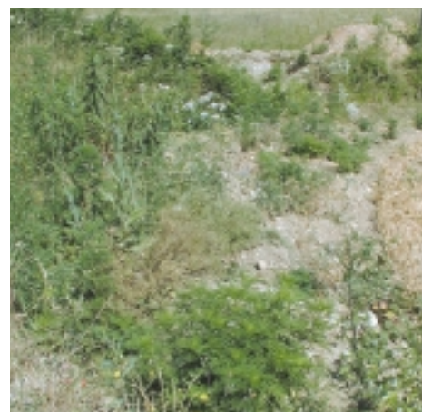
Les déblais sauvages peuvent constituer une « réserve » de graines, même si la densité des pieds d'ambroisie est faible.