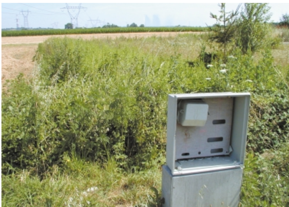
Les terrains viabilisés et restant en friche dans l'attente de la construction sont des sites privilégiés pour le développement de l'ambroisie.