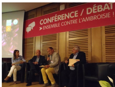
L'Isle d'Abeau (Isère)

Bilan du colloque de l'EWRS 2014 (Montpellier)